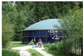
Förderung Biogasanlagen mit Hofdünger. Projektbeitrag à fonds perdu; Bereich Cleantech