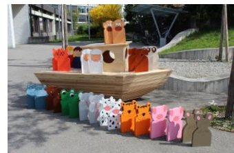
Spiel dich durch Langnau Projektbeitrag à fonds perdu Bereich Tourismus

Eine Übersicht aller unterstützten Projekte sowie weitere Informationen finden Sie unter www.region-emmental.ch , Bereich Regionale Entwicklung NRP.